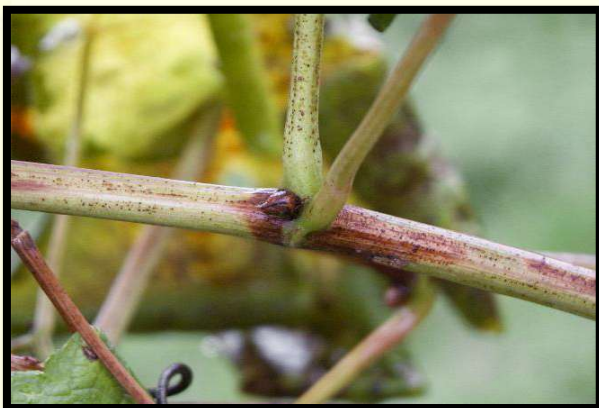
Príznak napadnutia na viniči (čierne pľuzgieriky)