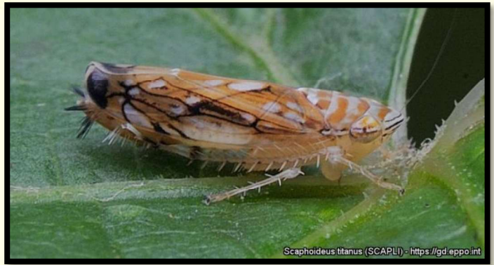
Scaphoideus titanus (cikádka viničová)