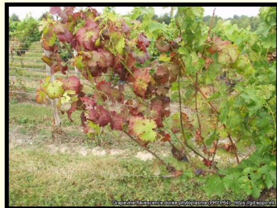
Príznak napadnutia na viniči (sčervenanie listov)