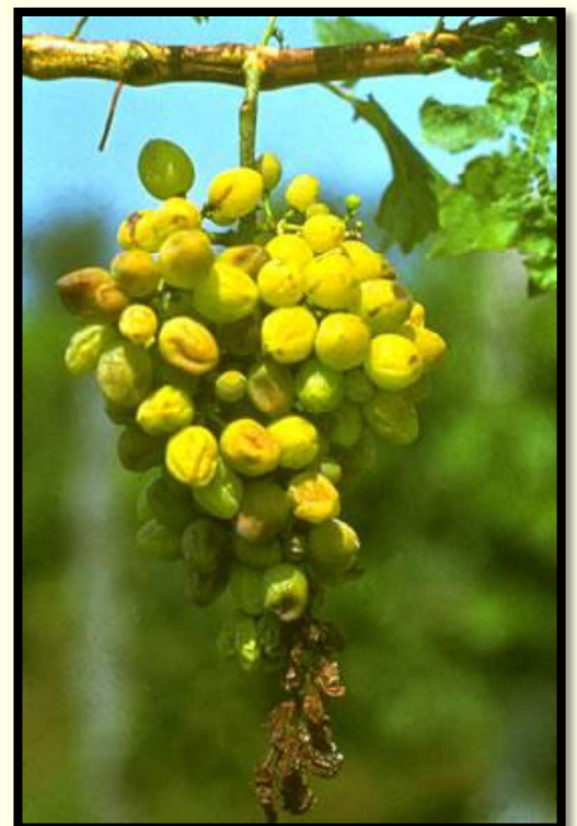
Príznaky pokročilej infekcie strapca hrozna so scvrknutými, miestami hnedými bobuľami