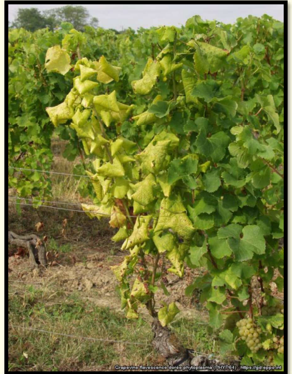
Žltnutie a stáčanie listov viniča