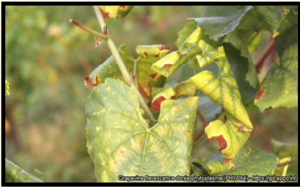
Detailnejší pohľad na žltnutie a stočenie listu viniča

Lokalizovať zlaté žltnutie viniča možno v cievných zväzkoch napadnutého viniča odkiaľ je prijímané vektormi pre ďalší prenos. Jediný infikovaný exemplár môže stačiť na prenos ochorenia a na začiatok nákazy. Fytoplazma bola nájdená v slinných žľazách infikovaného hmyzu (vektora) a sérologicky detegovaná v jednotlivých exemplároch.