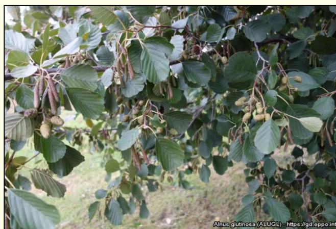
Alnus glutinosa (ALUGL) - https://gd.eppo.int