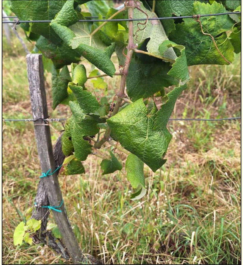
Žltnutie a typické stáčanie listov smerom nadol pri bielych odrodách viniča