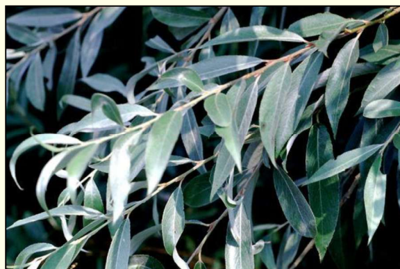
Hostiteľská rastlina vrba ( Salix sp.)