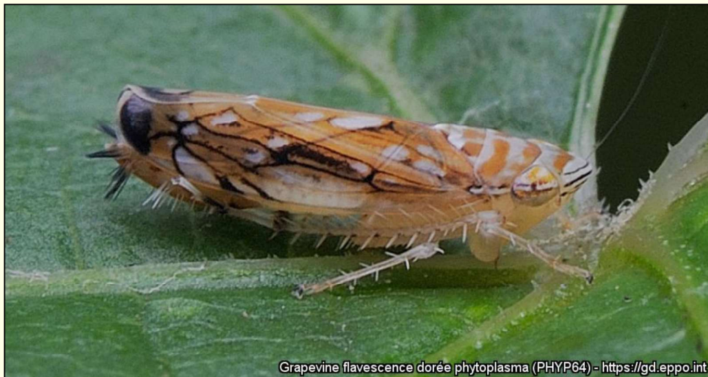
Grapevine flavescence dorée phytoplasma (PHYPP64) - https://gd.eppo.int