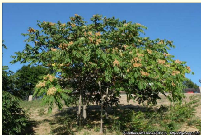
Ailanthus altissima (AILAL) - https://gd.eppo.int