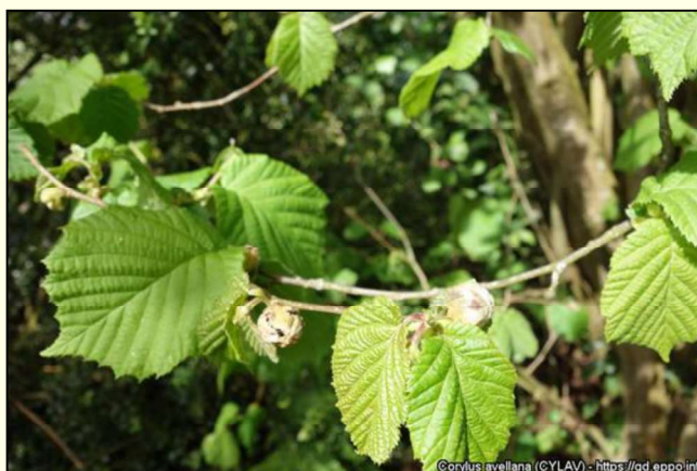
Corylus avellana (CYLAV) - https://gd.eppo.int