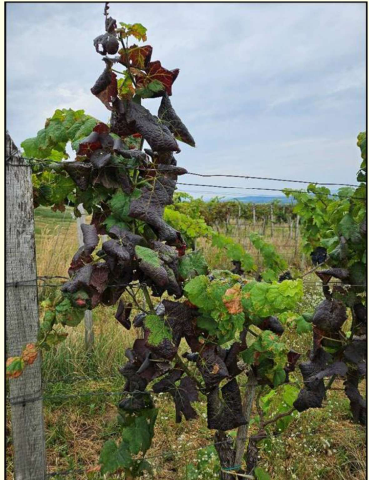
Na modrých odrodách viniča sčervenanie a stáčanie listov nadol